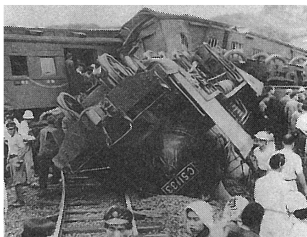
Y 福島県(東北本線松川駅付近)