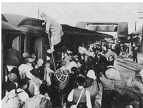
X 千葉県(総武本線飯岡駅)