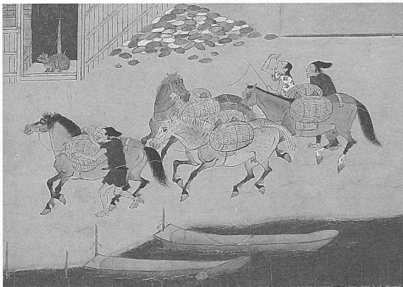
『石山寺縁起絵巻』(石山寺所蔵, 部分)

X 図に描かれたような運送業者は、馬の背に荷物を載せて陸路を往来し、ときには徳政を求めて蜂起した。