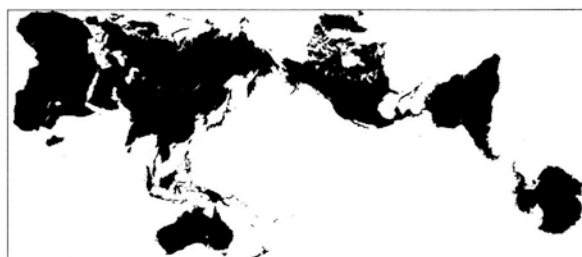
オーサグラフ世界地図